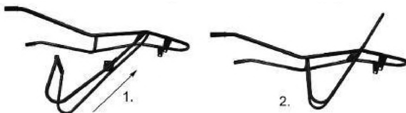
СХЕМА СБОРКИ И КОМПЛЕКТАЦИЯ ТАЧКИ СТРОИТЕЛЬНОЙ ELAND GIGANT 360-2 PROFİ